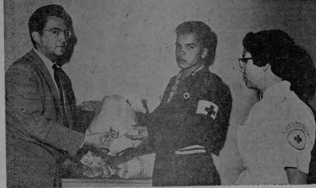
Anoche, en el radioteatro de la emisora "Monumental", se hizo entrega a los damnificados del último incendio en el Barrio Los Angeles, de C 1.500.00 en ropas y comidas, y en efectivo, recogidos en contribución popular. Desde el mismo día de la conflagración esa emisora, y los programas "La Palabra de Costa Rica" y "La Corte Suprema del Arte", más la Junta Progresista del Barrio Sagrada Familia, iniciaron un movimiento social con tal propósito. Solamente entre la gente pobre del Sagrada Familia, se recogieron C 400.00 entre pesetas y dieces. Por entrega directa y por conducto de la Cruz Roja, se distribuyeron los obsequios.—