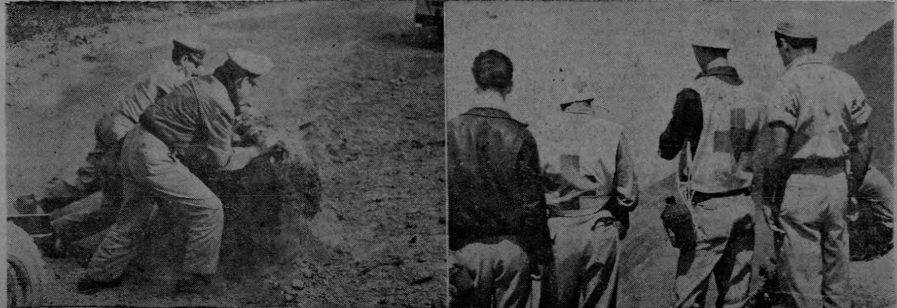
Un tronco lanzado por los pachucos en una trocha cercana al Volcán Poás es removida por oficiales de Radio Patrulla.— Miembros de la Cruz Roja observan la extracción de un beodo que se quería suicidar en el cráter del Poás. Los patrulleros salvaron más de 20 vidas