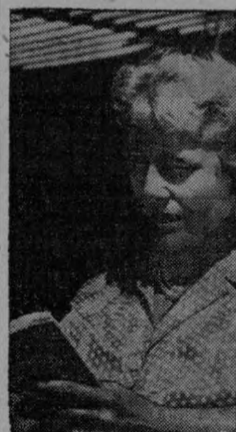
HACIENDO SU ASIGNACION. La Sra. Clare Booth Luce, recientemente designada Embajadora al Brasil por el Presidente Eisenhower, estudia en el patio de su casa en Phoenix, Arizona, sobre el país donde espera servir. La designación de la Sra. Luce espera aun la confirmación por el Senado de Estados Unidos

BUENOS AIRES, 21 (UPI). — Dos pequeños petardos estallaron en medio de una multitud que escuchaba el discurso de uno de los dirigentes revolucionarios que visitan esta ciudad. No hubo lesionados, y un tercer petardo no hizo explosión. El incidente ocurrió cuando partidarios del ex dictador argentino Juan Domingo Perón trataron de interrumpir el acto organizado en honor de los visitantes cubanos, con gritos de "viva Perón". Finalmente la policía dispersó a los peronistas.