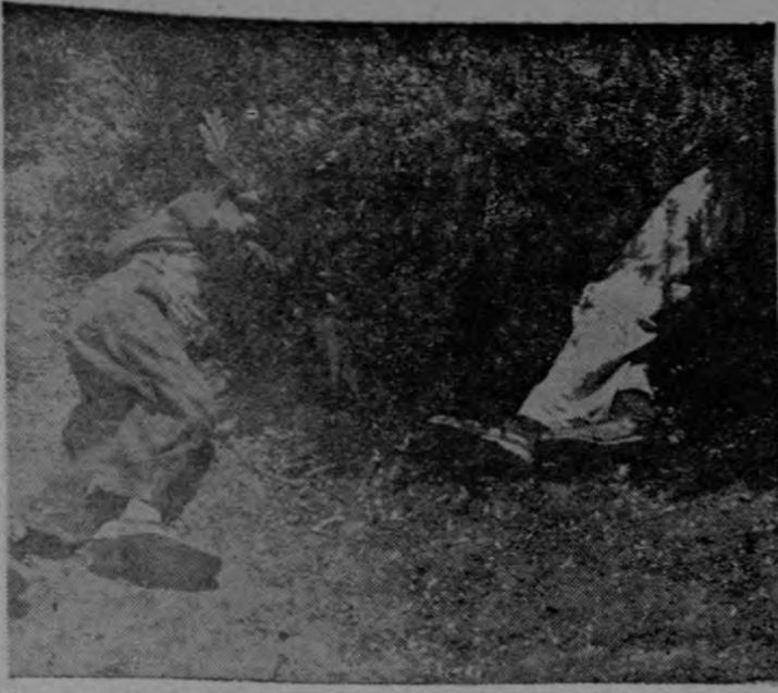
Estos dos ciudadanos, tirados bajo una bóveda natural de arráyanes, duermen el sueño de los beodos. Minutos más tarde los patrulleros los rescataron semi-asfixiados por una erupción

EL PLAN DE VIGILANCIA. El plan puesto en práctica por la Compañía de Radio Patrullas en la cumbre del volcán y montañas vecinas es simple pero de gran valor para los paseantes dominicales. Se puede concretar en una acción de patrullaje y salvamento y un ordenamiento eficaz del tránsito en las trochas de penetración que permiten hoy día el paso de jeeps y otros vehículos de doble tracción hasta el borde mismo del maravilloso cráter. Pero, además, se puede también señalar co-