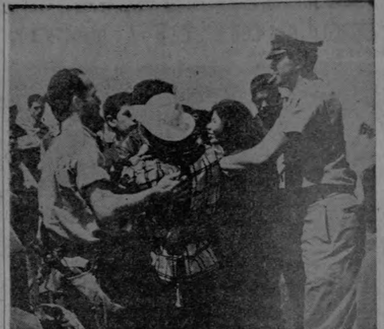
Este es uno de los 14 pleitos que se escenificaron al borde del abismo. Los patrulleros en acción tratan de evitar que un alturado excursionista eche mano a su puñal